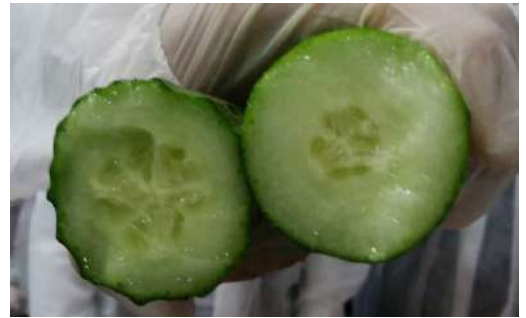
左:通常のロングキュウリ品種、右:コンサピーノ